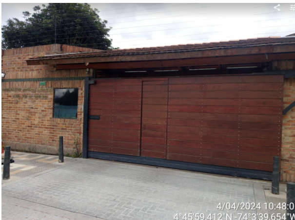
Fotografía 1. Fachada del conjunto residencial Sierra Monte 1