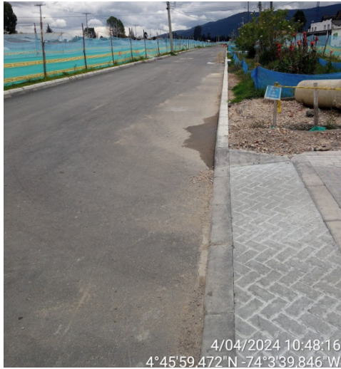
Fotografía 3. Redes de alcantarillado A. Boyacá