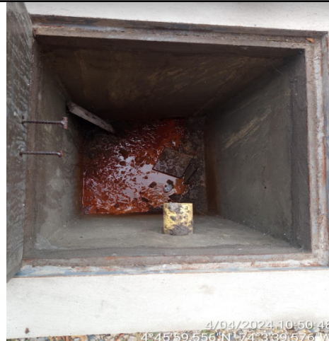
Fotografía 2. Caja externa – Tubería salida aguas servidas