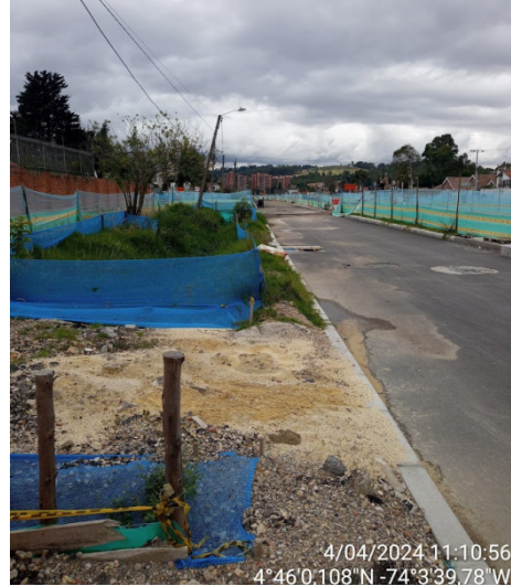
Fotografía 4. Obras en la Av. Boyacá